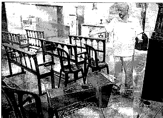
El sacerdote muestra la ventana por la que entraron los ladrones y algunos de los desperfectos que provocaron en la iglesia alcireña de la Sagrada Família.